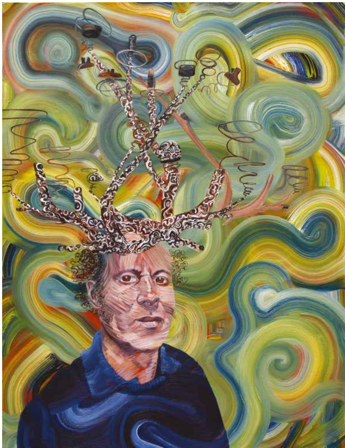
Le Myrobolan (2021) – 95 x 73 cm – huile sur toile. Miguel Marajo / ADAGP.