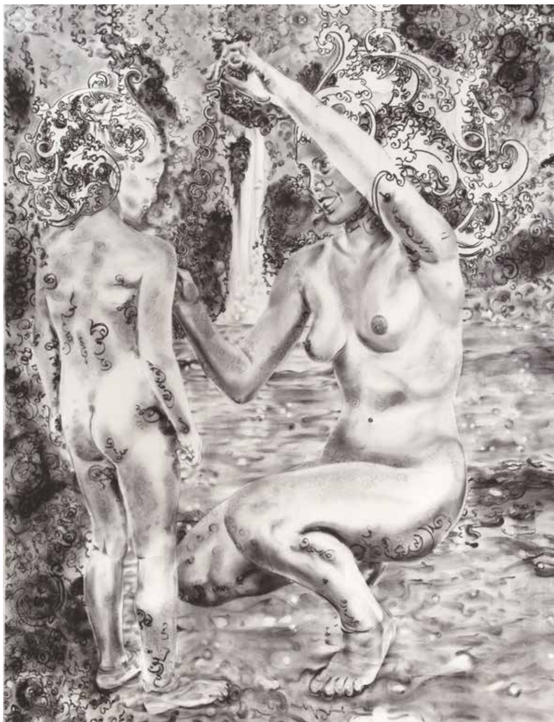
Mire et Fi (2021) – 148 x 117 cm – fusain sur papier Arches. Miguel Marajo / ADAGP.