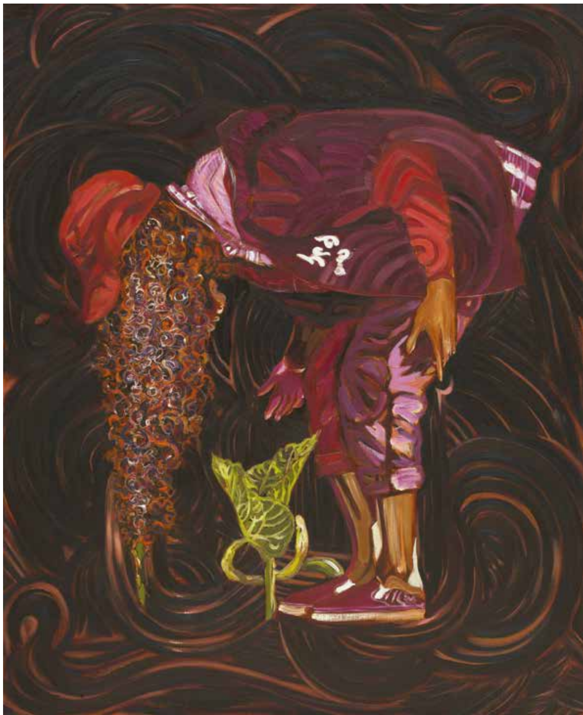
Dans les choux (2018) – 92 x 75 cm – huile sur toile. Miguel Marajo / ADAGP.