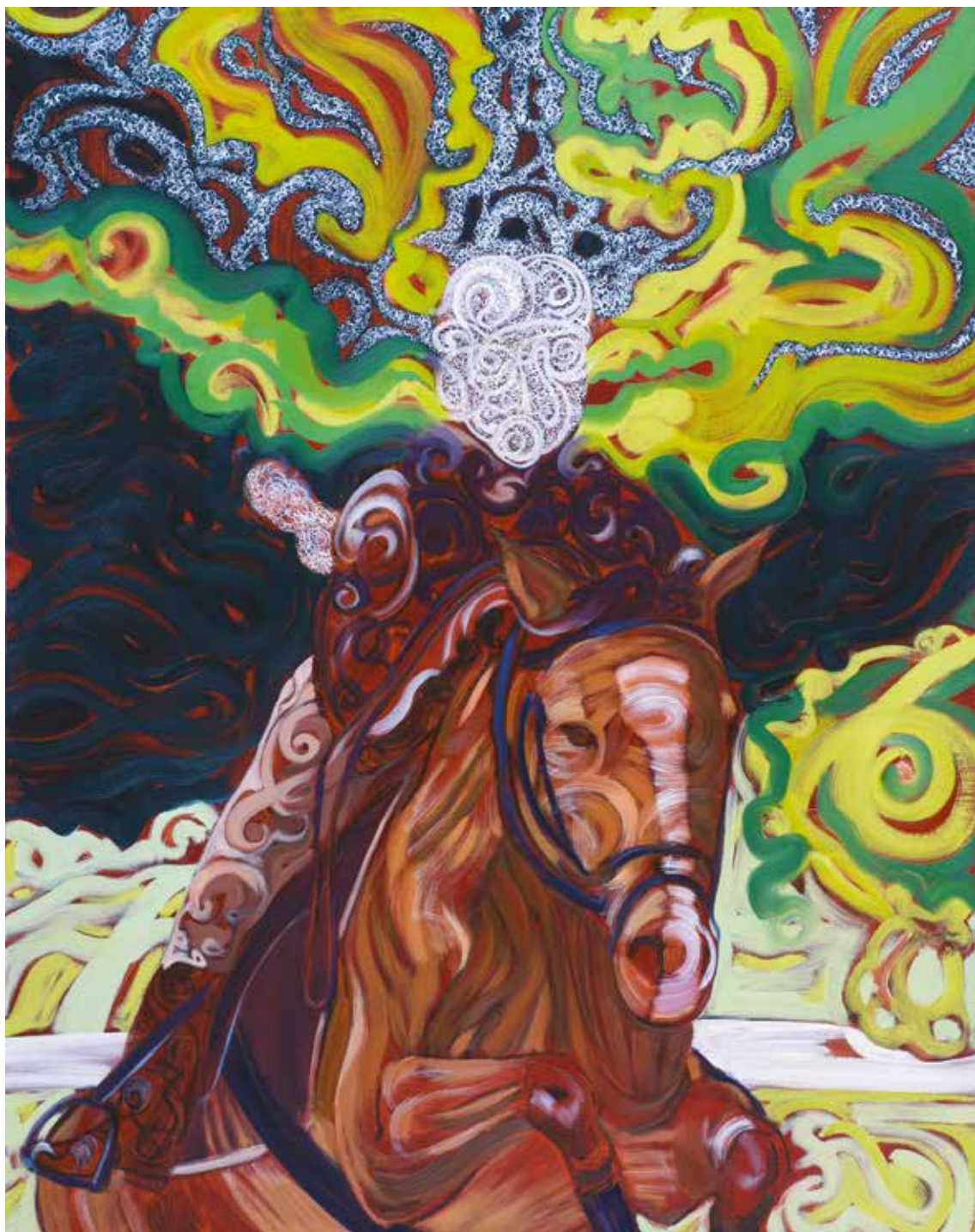
Au galop [2017] – 92 x 73 cm – huile sur toile. Miguel Marajo / ADAGP.