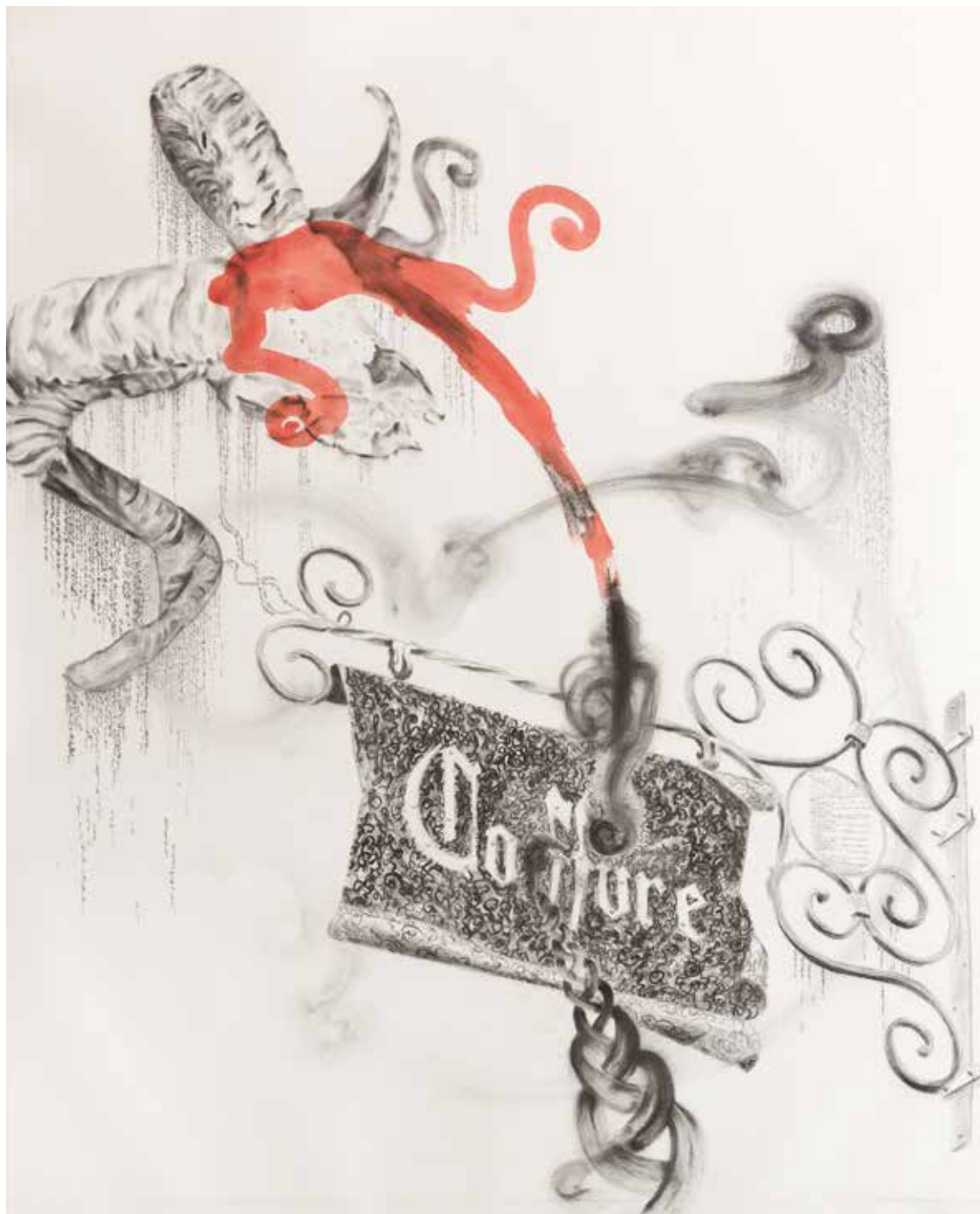
L'enseignement (2018) – 160 x 130 cm fusain, graphite et aquarelle sur papier. Miguel Marajo / ADAGP.