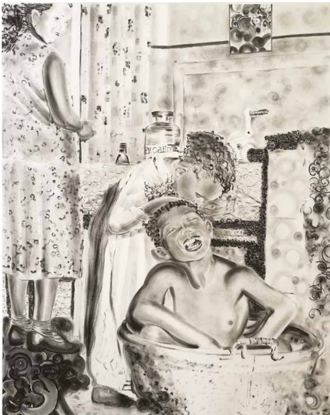
Alcalin (2019) – 160 x 130 cm – fusain sur papier Arches. Miguel Marajo / ADAGP.