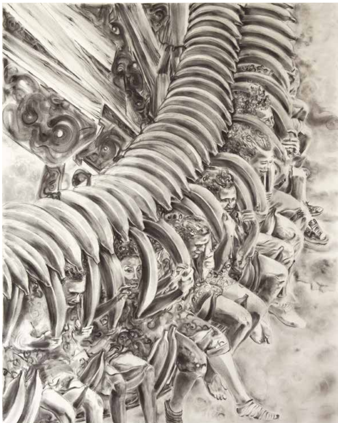
Régime Subanana (2018) – 157 x 125 cm – fusain sur papier. Miguel Marajo / ADAGP.