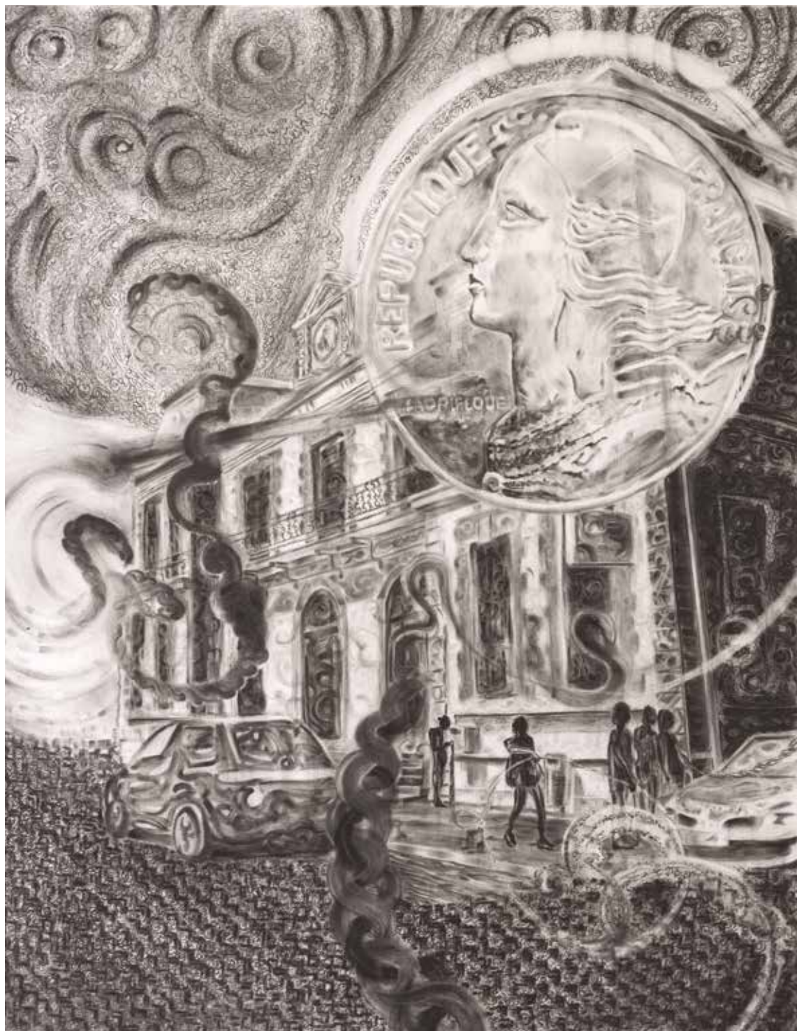
Vingt sentiments (2018) – 160 x 130 cm – fusain sur papier. Miguel Marajo / ADAGP.