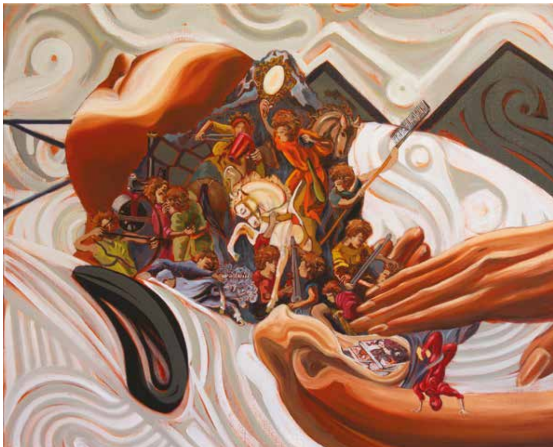
Cheveux en bataille (2017) – 65 x 81 cm – huile sur toile. Miguel Marajo / ADAGP.