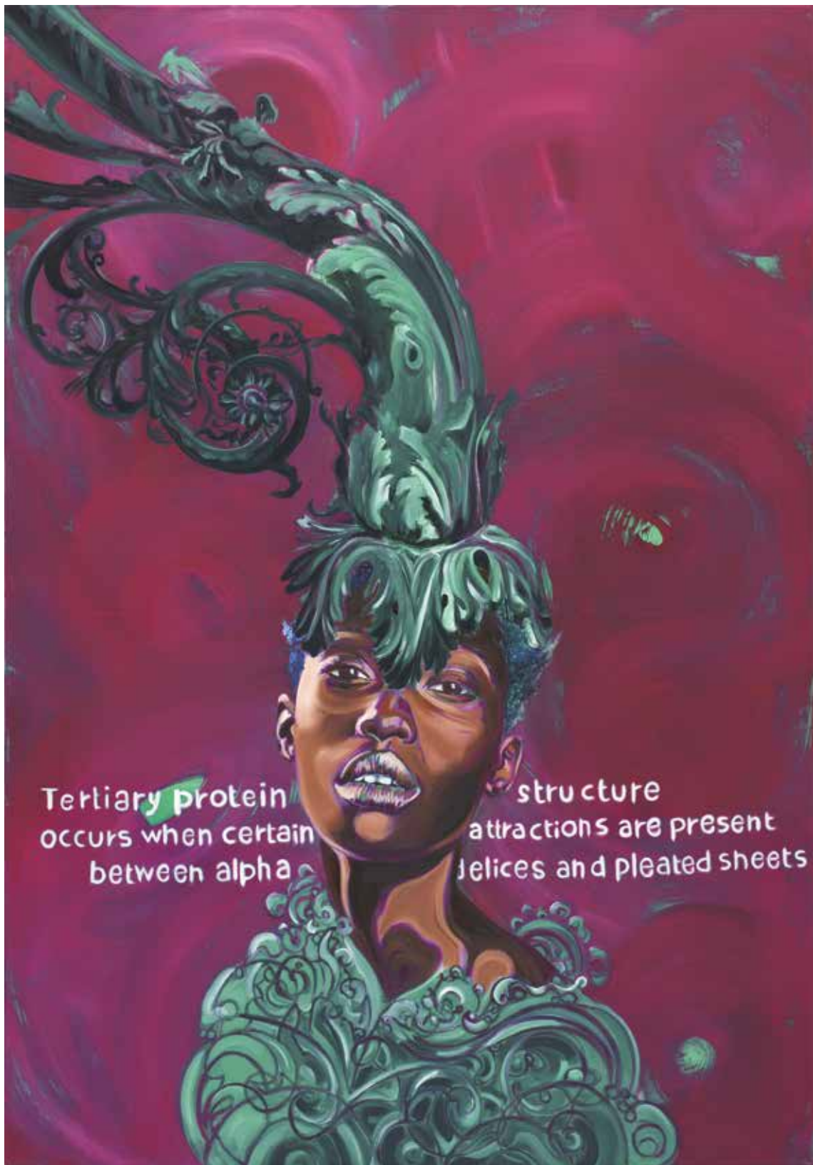
Entre les plis des feuilles vertes (2018) – 116 x 81 cm – huile sur toile. Miguel Marajo / ADAGP.