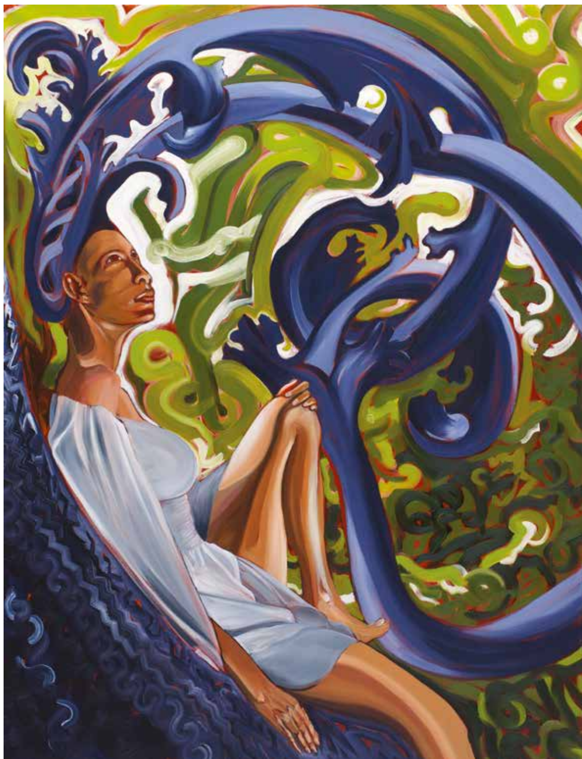
Lee Anne (2017) – 116 x 89 cm – huile sur toile. Miguel Marajo / ADAGP.